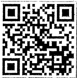
๑. ลงทะเบียนเข้าร่วมงาน

ผู้กู้ยืมสามารถลงทะเบียนเข้าร่วมงานล่วงหน้าและรับสิทธิขอไกล่เกลี่ยฯ ได้ทางเว็บไซต์ www.studentloan.or.th ของกองทุนเงินให้กู้ยืมเพื่อการศึกษา (กยศ.) หรือ สแกน Qr code