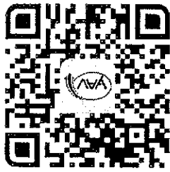
๒. ลงทะเบียนแอปพลิเคชัน กยศ. Connect